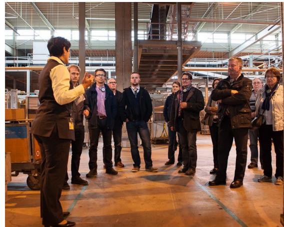
Gwärbler beim aufmerksamen Zuhören.

Anschliessend ging es durch die Hallen des Briefverteilzentrums, welches ein Steinwurf vom Paketzentrum entfernt ist. Dort konnten wir beobachten wie pfeilschnell die Briefsortierung an die entsprechenden Postleitzahlengebiete zugeteilt wird.